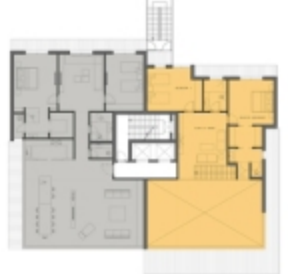
Duplex Upper Floor Plan(115m)

louvers protect from the excessive eastern and western exposure while adding